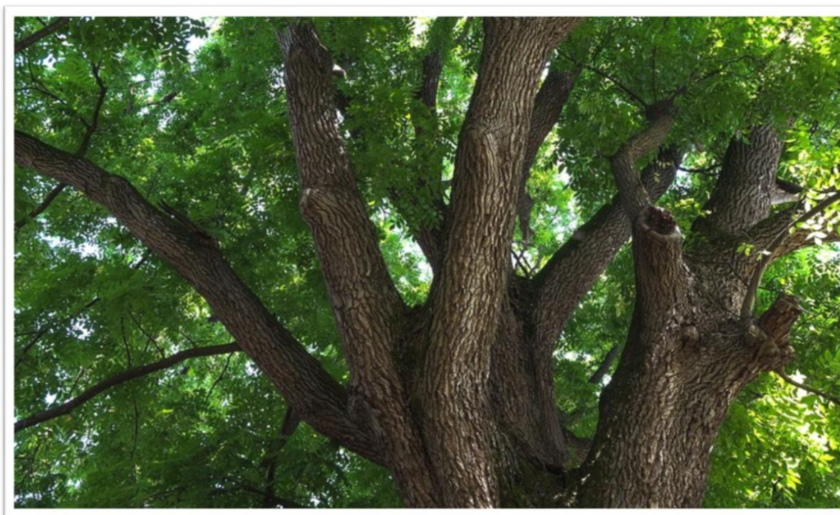
Слика 4: Заштићено стабло ораха ( лат: Juglans regia L. ) у мјесној заједници Нова Топола

Задатак Управљача је да успостави организованост у погледу управљања природним вриједностима подручја унутар граница Споменика природе, на бази повјерених послова и утврђених обавеза из Одлуке о заштити 13 .