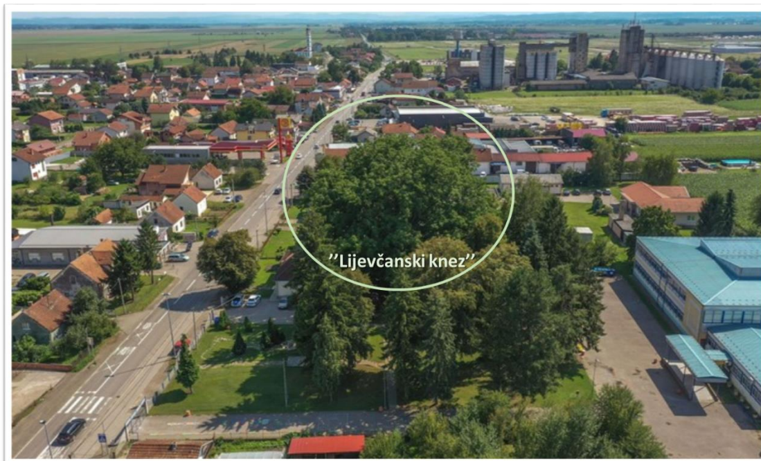
Слика 1: Мјесна заједница Нова Топола, поглед на стабло заштићеног ораха

по дужој оси 37,00 m, по краћој оси 36,00 m.