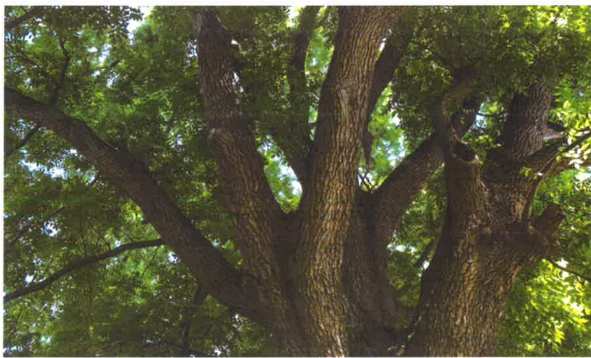
Слика 4: Заштићено стабло ораха ( лат: Juglans regia L. ) у мјесној заједници Нова Топола

Задатак Управљача је да успостави организованост у погледу управљања природним вриједностима подручја унутар граница Споменика природе, на бази повјерених послова и утврђених обавеза из Одлуке о заштити 13 .