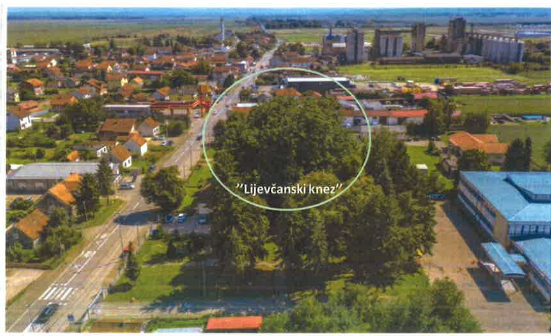
Слика 1: Мјесна заједница Нова Топола, поглед на стабло заштићеног ораха

по дужој оси 37,00 m, по краћој оси 36,00 m.