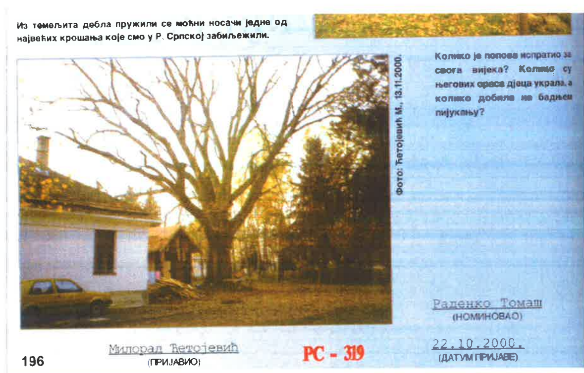
Слика 2: Каталог највећих стабала Републике Српске, Бања Лука 2003. године

Због димензија, стабло је евидентирано у Каталогу највећих стабала Републике Српске, прво издање из 2003. године, аутора Југослава Брујића и сарадника, у издању Шумарског факултета Бања Лука и ЈПШ Српске Шуме РС.